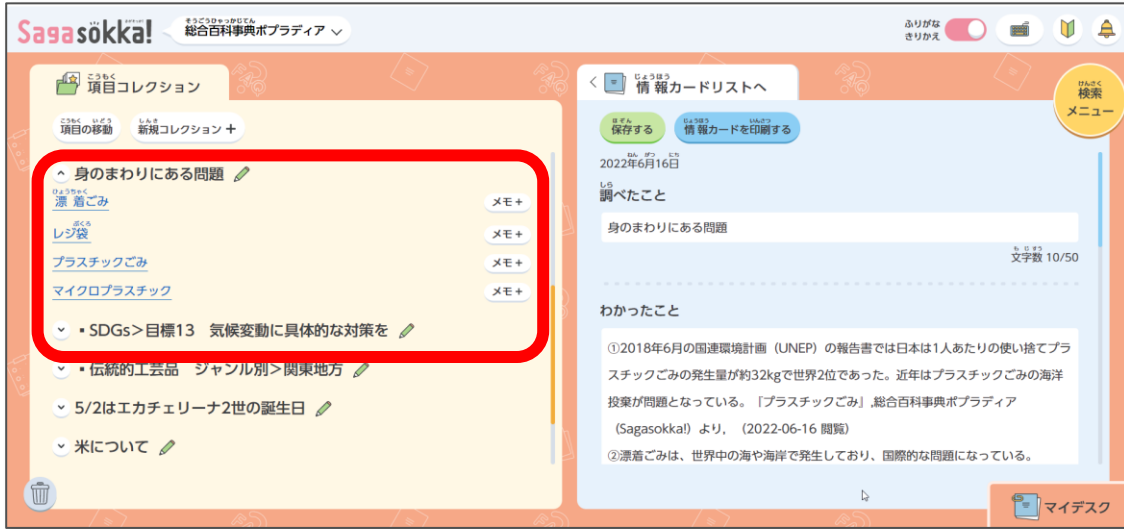
【項目コレクション】身のまわりにある問題に関する項目をコレクションした例

※【項目コレクション】【情報カード】は個別のID認証のみでご利用いただける機能です。