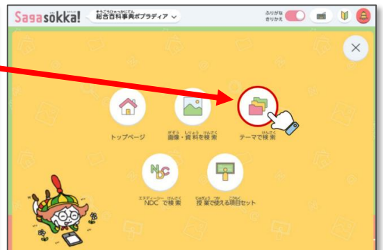
【検索メニュー】トップページ画面右上の検索メニューボタンをクリックすると現れる画面より【テーマで検索】を選択