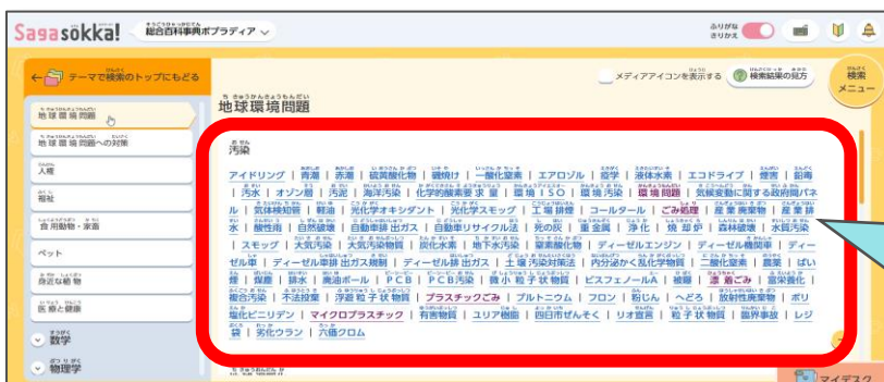
【テーマで検索】画面より「暮らし」地球環境問題＞汚染を選択

テーマを見つける際に役立ちます。また興味を持った、疑問に思った項目をクリックすればその項目にジャンプ。情報収集がすばやくできます。